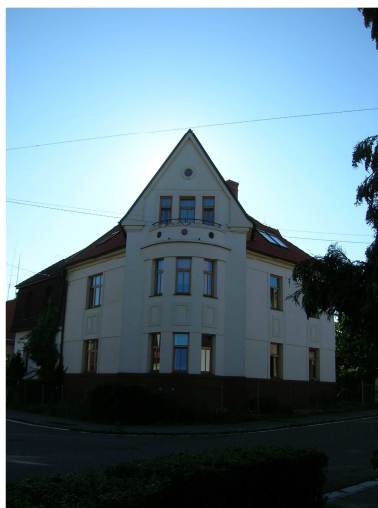
Obr. č. 1 Sídlo organizace